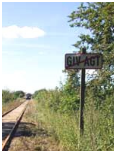
Giv agt (usigtbart vejr)

Mærkerne findes i SR (nr. 17.3 og 17.4). Ved SFvJ ses de mange steder langs banen mellem Faaborg og Korinth - typisk nær ubevogtede overkørsler som skov- og markveje.