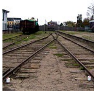
Opstilling af frispormærker

"Frispor" angiver, hvor langt et køretøj (pufferne) kan føres frem på det ene af to sammenløbende spor uden at hindre kørsel på det andet spor. Det består af to porcelænsklokker (udgaverne ved SFvJ er replica udført i stål) anbragt mellem sporene tæt op til skinnernes udvendige sider.