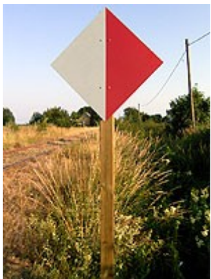
"Station uden I-signal" (Stationsmærke)

"Station uden I-signal" (Stationsmærke) markerer grænsen mellem den fri bane og stationsområdet. Mærket, der er en kvadratisk plade delt diagonalt i en rød og en hvid halvdel, vender ud mod den fri bane.