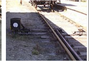
Medgående sporskifte stillet til krumt spor

"Lige spor" betyder, at sporskiftet er stillet til kørsel ad det mindst krumme spor.