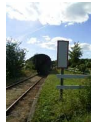
Perron ved trinbræt

"Perron ved trinbræt" viser, hvor en perron ved et trinbræt er beliggende. Mærket er anbragt umiddelbart foran perronen og til højre for sporet set i kørselsretningen. "Perron ved trinbræt" består af en lodretstillet rektangulær hvid plade med rød kant.