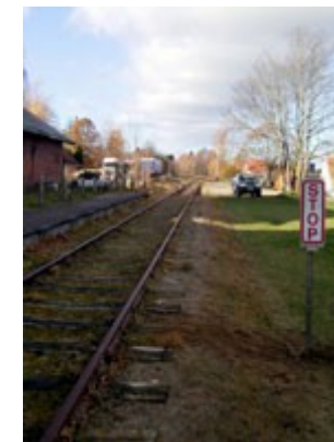
Opstilling af mærke "Stop"

"Stop" betyder, at et indkørende tog skal standse senest foran mærket.