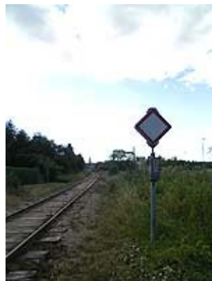
"Station uden I-signal" (Stationsmærke)

"Station uden I-signal" (Stationsmærke) markerer grænsen mellem den fri bane og stationsområdet. Mærket består af en kvadratisk hvid plade med røde kanter og vender ud mod den fri bane.