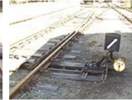
Modgående sporskifte stillet til krumt spor