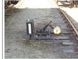
Sporskiftet stillet til lige spor