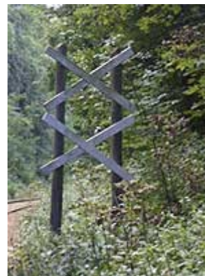
Kendingsmærke for holdsted uden sidespor og hovedsignaler

"Kendingsmærke for holdsted uden sidespor og hovedsignaler" tilkendegiver, at der 500 m bag mærket er et trinbræt uden sidespor og hovedsignaler. Mærket består af to hvide kryds, der er anbragt på to standere umiddelbart til højre for sporet.